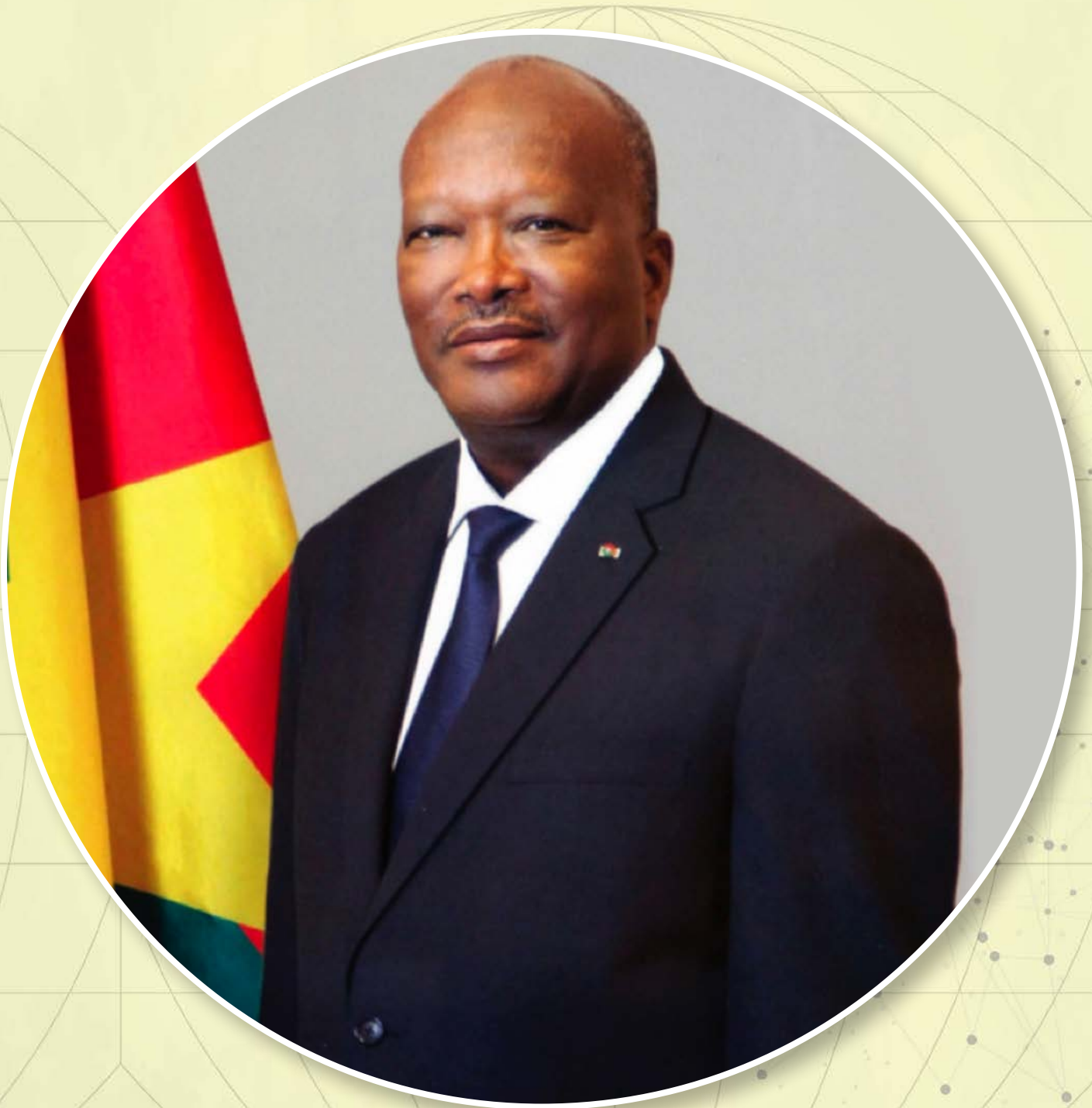
Roch Marc Christian KABORÉ

Sous le très haut patronage de SEM. le Président du Faso